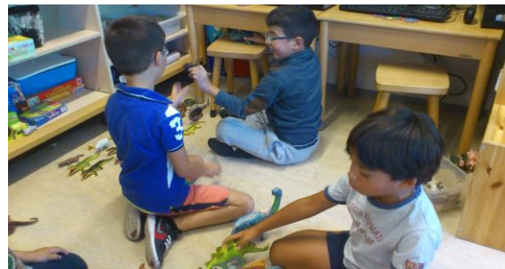
Groep 4 is heerlijk aan het werk met bouw materiaal en dino's.