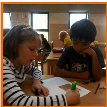
Expert lezen in groep 5B