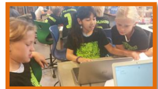
Groep 6A op het Caland lyceum voor de Team Innovation Challenge!