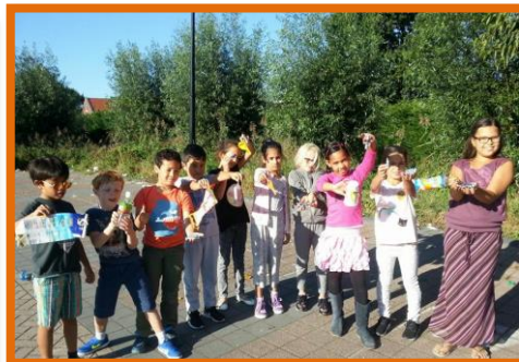
En ze zijn ook nog eens expert in het opruimen van het schoolplein!