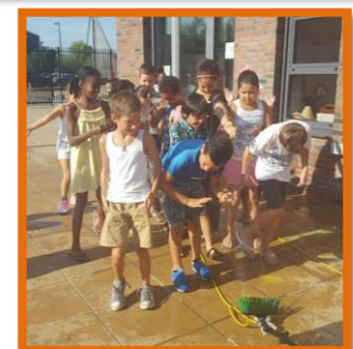
Waterpret met de glazenwasser