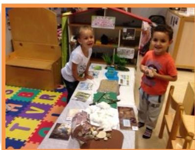
Activiteiten in groep 1/2 E voor de kinderboekenweek! De verteltafel! "Wij gaan op berenjacht" wordt nagespeeld!