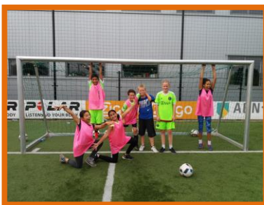
Groep 8B kreeg voetbaltraining bij De Toekomst van AFC AJAX