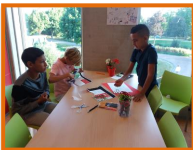
Thema Amsterdam? Wij denken aan Johan Cruijff! Deze jongens maakten een muurkrant over de voetballegende.