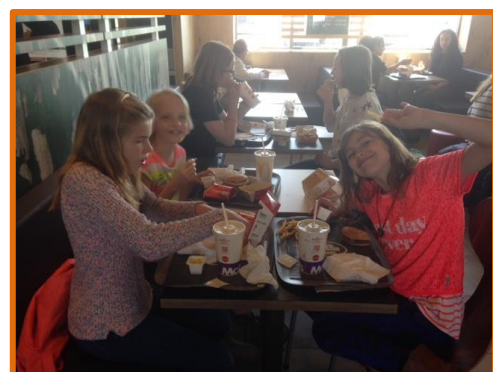
Groepen 8 ter afsluiting van de Cito – toetsen naar de Mac Donalds!