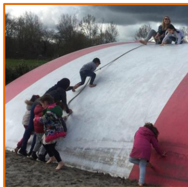
Schoolreisje van de groepen 1/2 bij De Zwaan!