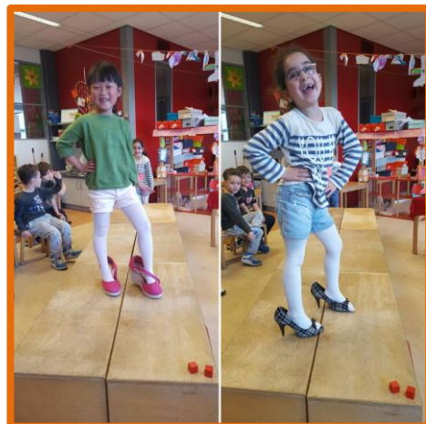
Thema afsluiting groep 1/2C