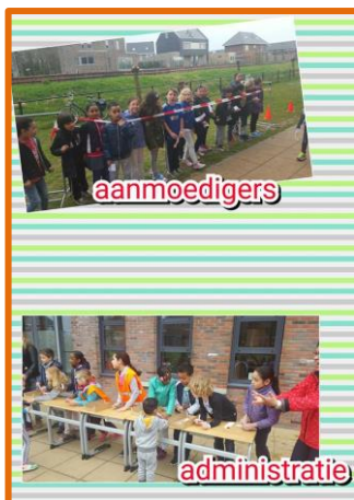
Sponsorloop: aanmoedigen, rennen en elk rondje aftekenen!