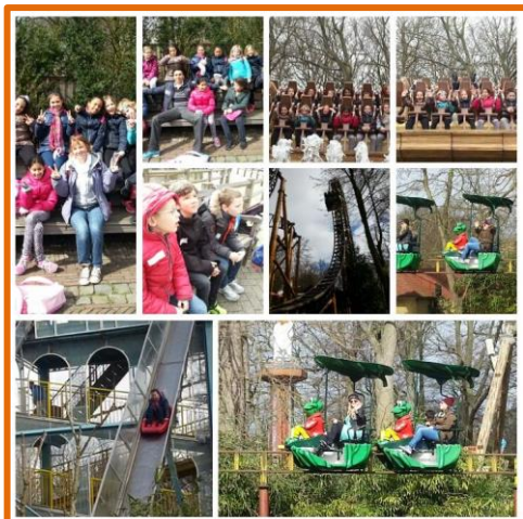
Schoolreisje Duinrell groep 5/6