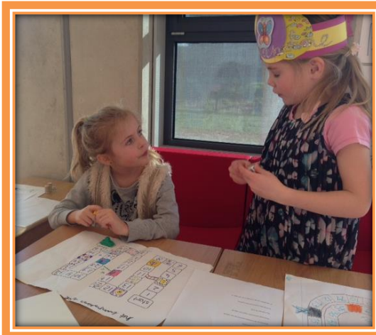
De kinderen uit groep 3 ontwikkelen zelf een spel met kranten!