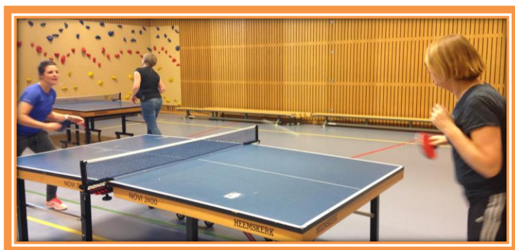
Een sportieve vrijdagmiddag na schooltijd voor de leerkrachten!