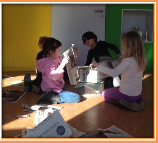
De kinderen uit groep 2 bouwen een toren