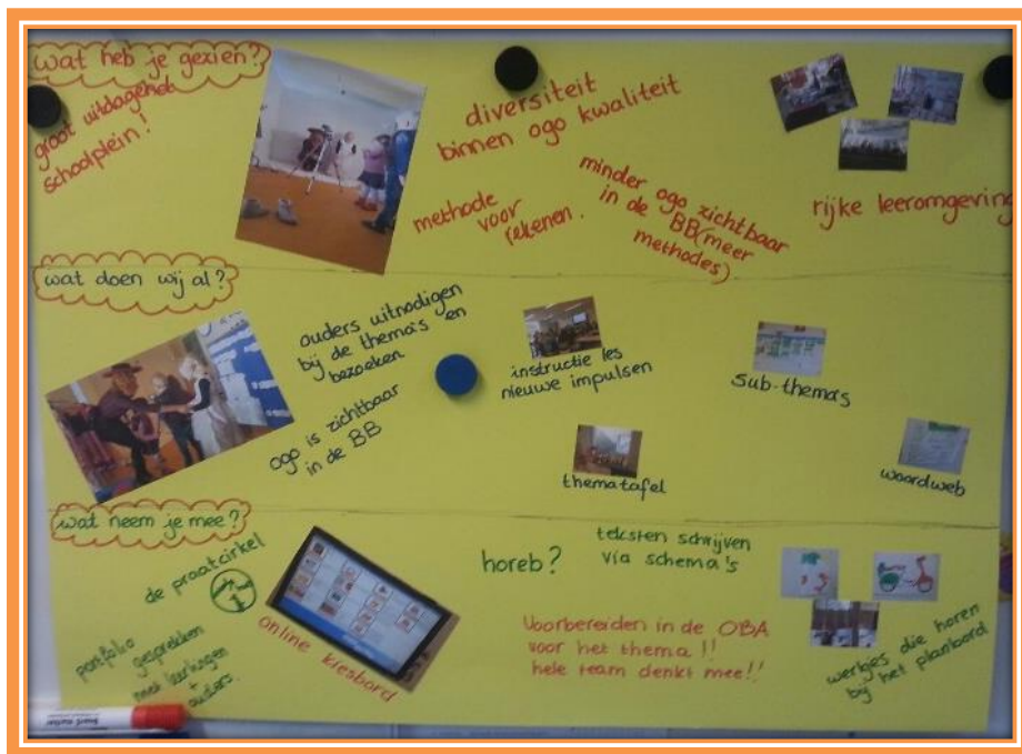
Opbrengsten OGO kijk dag.