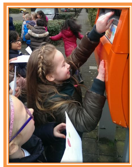
Groep 3B post een valentijnskaart!